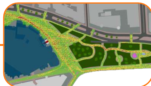
Simulateur ONHYS ONE