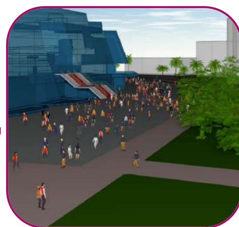
Visualisation sur jumeau numérique