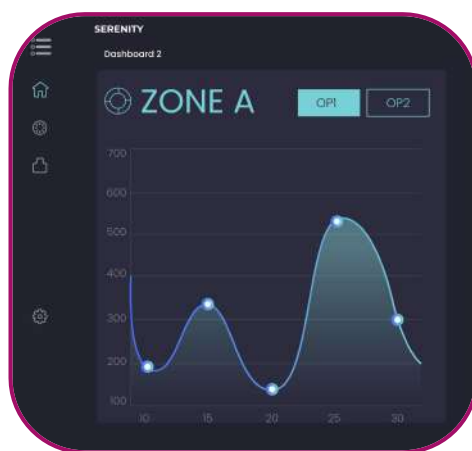
Superviseur ONHYS Qualia